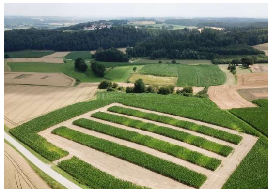
Dauerfeldversuch zur Wirkung von Pflanzenkohle in Kombination mit Gülle und Mineraldünger, Versuchsstation Thalhausen

Die Fachtagung informiert über aktuelle Forschungsarbeiten und Ergebnisse transdisziplinärer Forschungsprojekte zu den Themenschwerpunkten „ Digitales Nährstoffmanagement “ und „ Wirkungen und Anwendungspotenziale von Pflanzenkohle in der Landwirtschaft “.