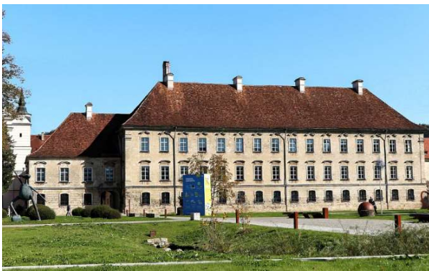
Die Klosterkirche Raitenhaslach und der 1762 fertiggestellte Prälatenstock, heute Sitz des TUM Akademiezentums

im Akademiezentrum Raitenhaslach und Versuchsstationen der Technischen Universität München