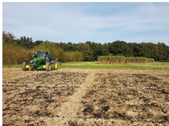
Versuche mit Pflanzenkohle und Kompost in der Versuchsstation Roggenstein der Technischen Universität München