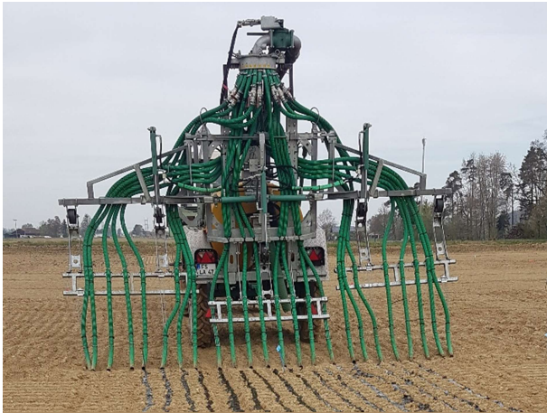
Ausbringung von Gärresten mit Pflanzenkohle, Projekt TerraBayt