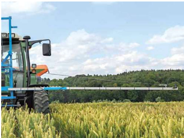
Einsatz eines multispektralen Sensors in Winterweizen, Projekt digisens